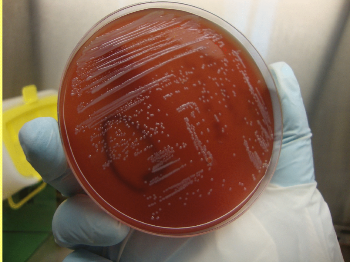
Colonies grises de Brucella melitensis sur gélose au sang frais de mouton au bout de 48 heures d'incubation.